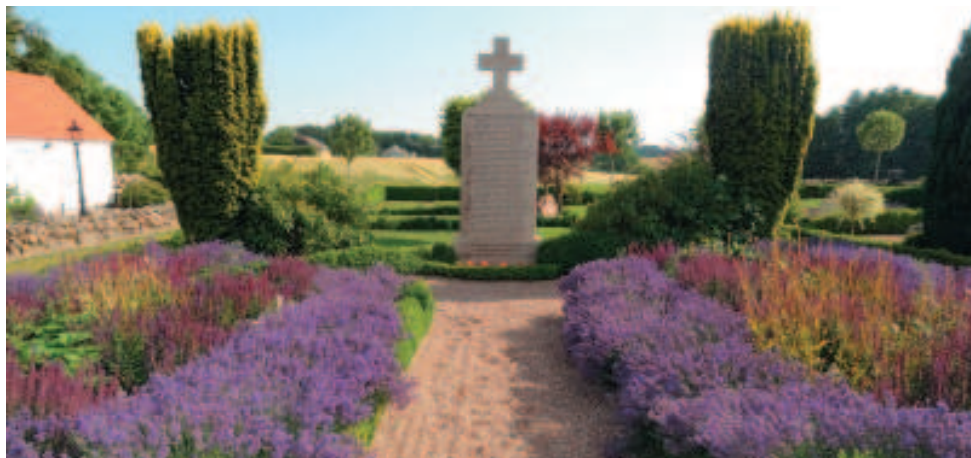
Mindesten ved Halk Kirke.