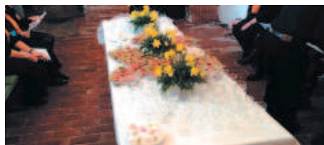
Skærtorsdagsfejring i Grarup Kirke.