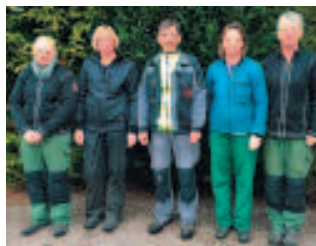
Gravermedhjælperne ved Halk-Grarup og Øsby-Aarø kirker, fra venstre mod højre: