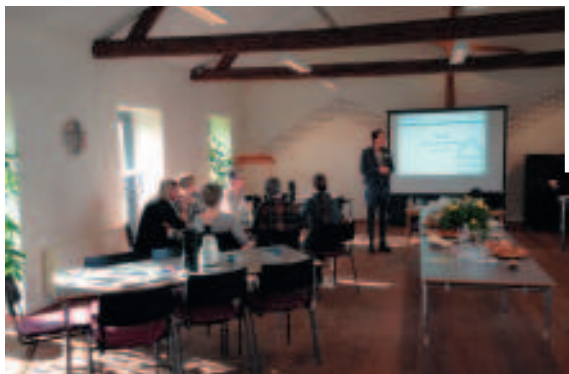
Fra personalets Temadag.