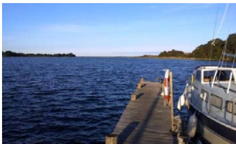
Udmundingen af Haderslev Fjord set fra Stevelt Bådebro

Den 8/9 var vi en flok interesserede, der fik et oplæg i Øsby Kirke, hvorefter vi vandrede en del af ruten fra Bibelcampingpladsen ved Jørlbjerg til Stevelt Bådebro - en fantastisk tur lige i vandkanten. Det bliver storslået, hvis turen med tiden også kan føre til Vilstrupegnen via Årø Sund og Bankel.